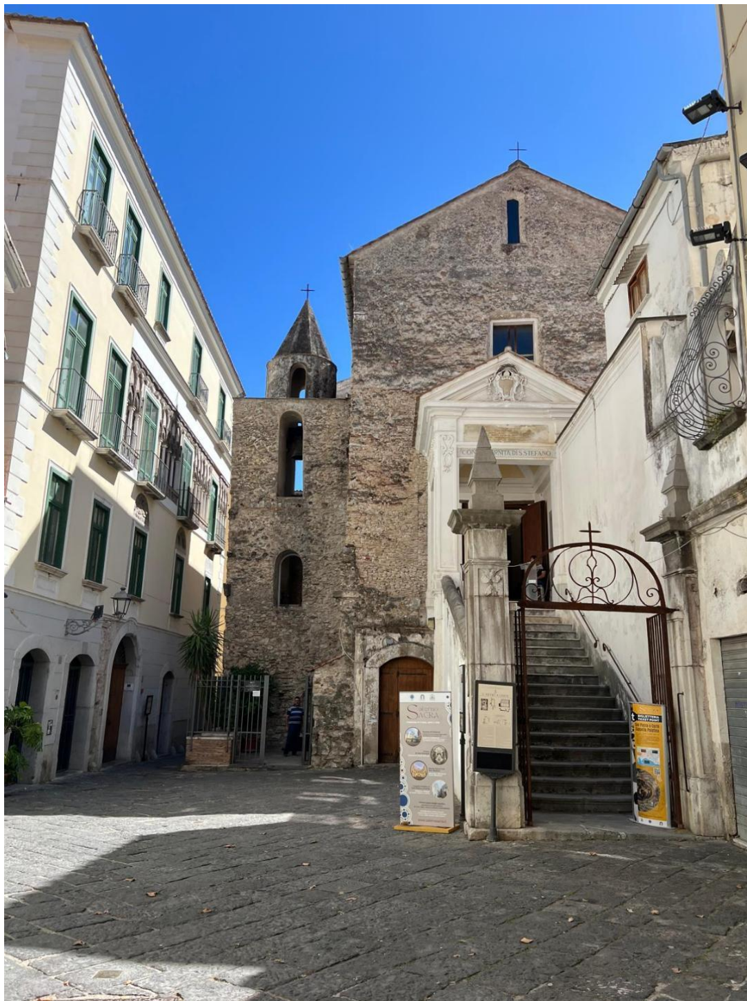
L'ingresso della prima sede della Scuola Medica Salernitana nel complesso di San Pietro a Corte