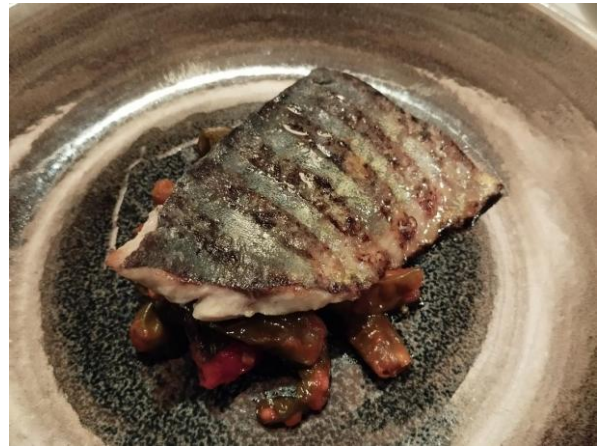
Cernia ai ferri