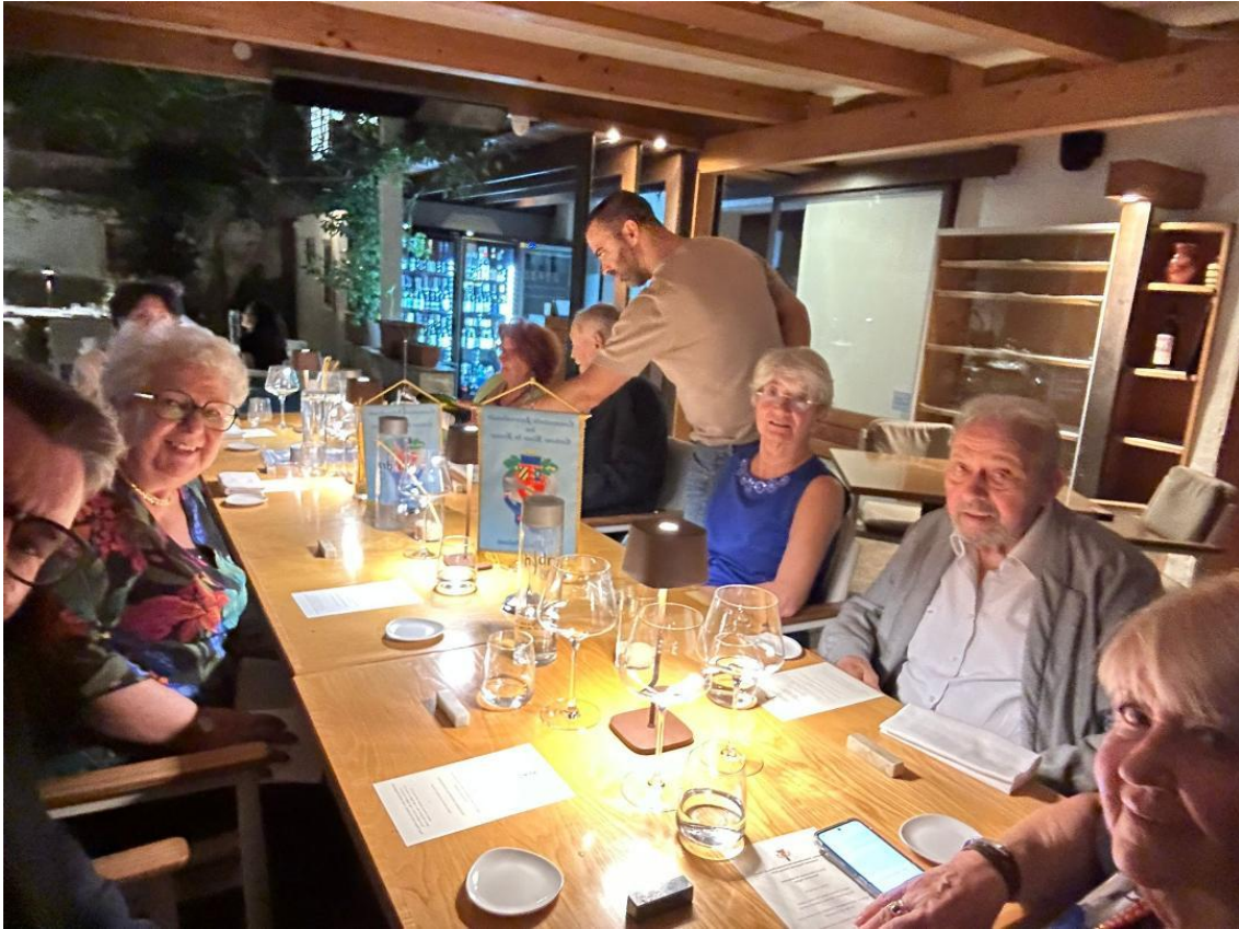
La cena di benvenuto