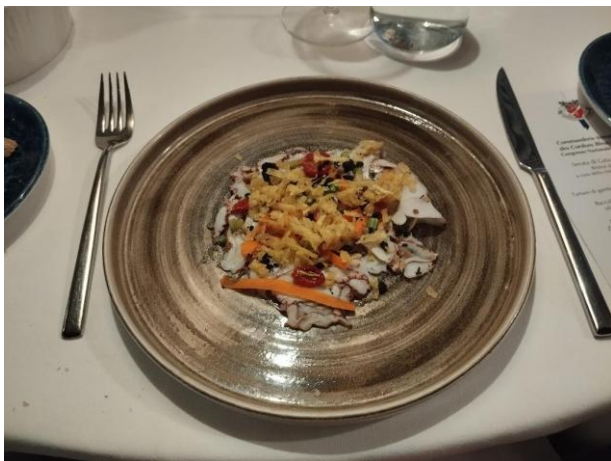
Tortino di alici