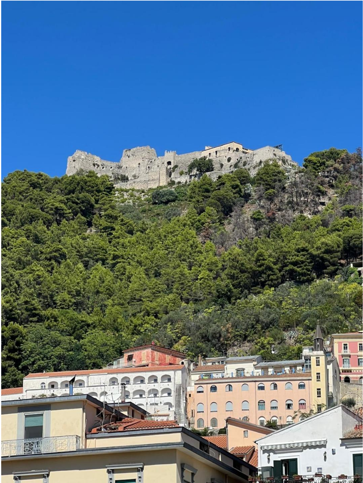
Salerno, vista del Castello di Arechi