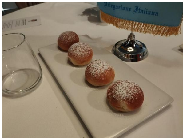
Il dessert di dolci