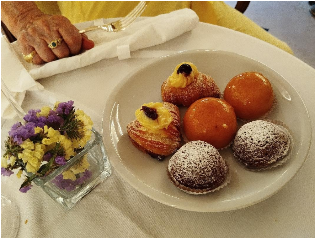
Assortimento di dolci dell'antica pasticceria Pansa di Amalfi