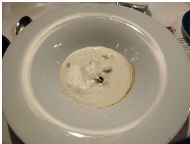
Zuppetta di toitani