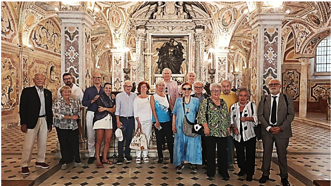
La visita alla Cripta del Duomo di Salerno