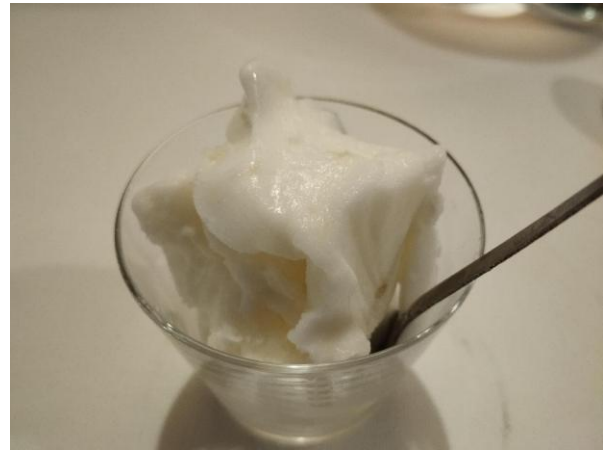
Il sorbetto al limone