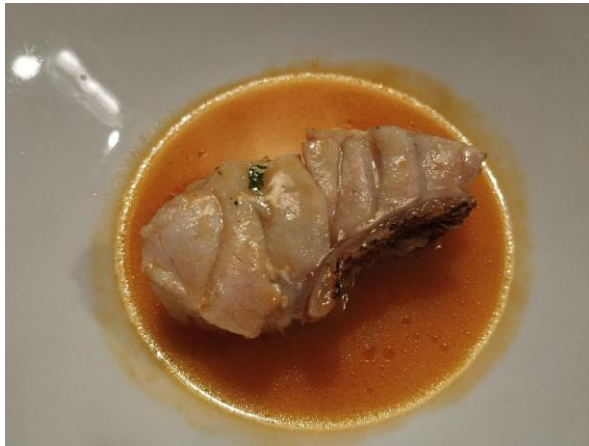
Lampuga all'acqua pazza