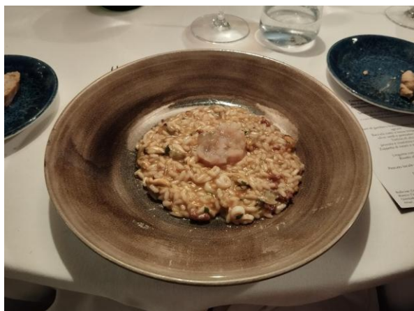
Risotto alla pescatora