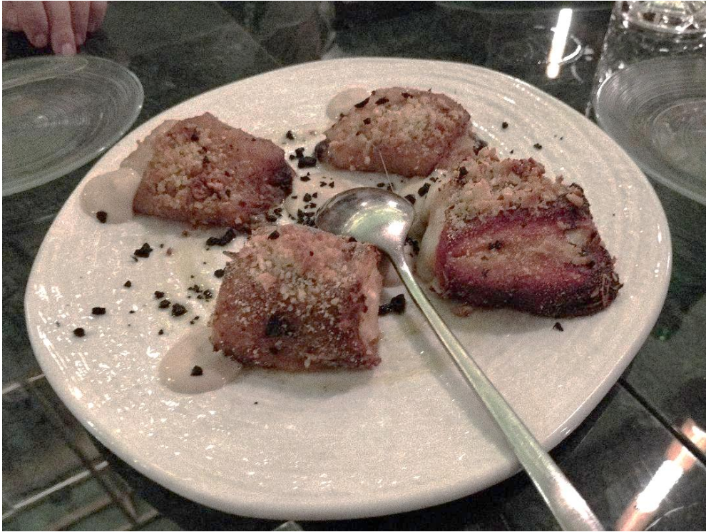
Peperoni ripieni alla napoletana, una delle numerose entrées del menu del Ristorante Gioia Cucina di Terra