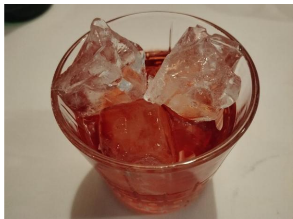
Il Negroni del Bistrot con gin infuso nelle foglie di fico