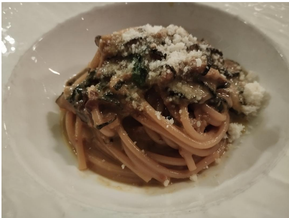
Spaghetti alla Nerano