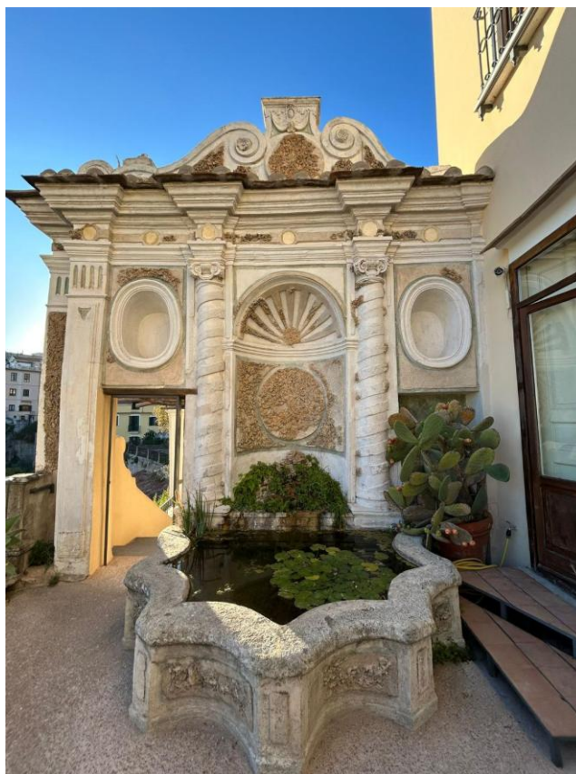
L'ingresso del Giardino della Minerva