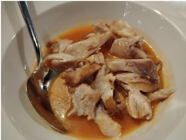
Le guancette della cernia