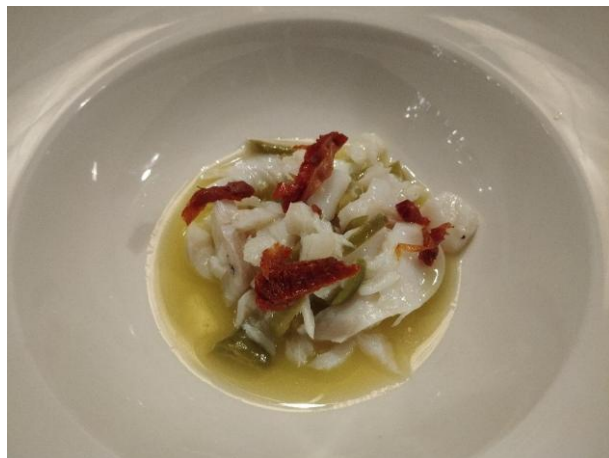
Baccalà cotto a bassa temperatura