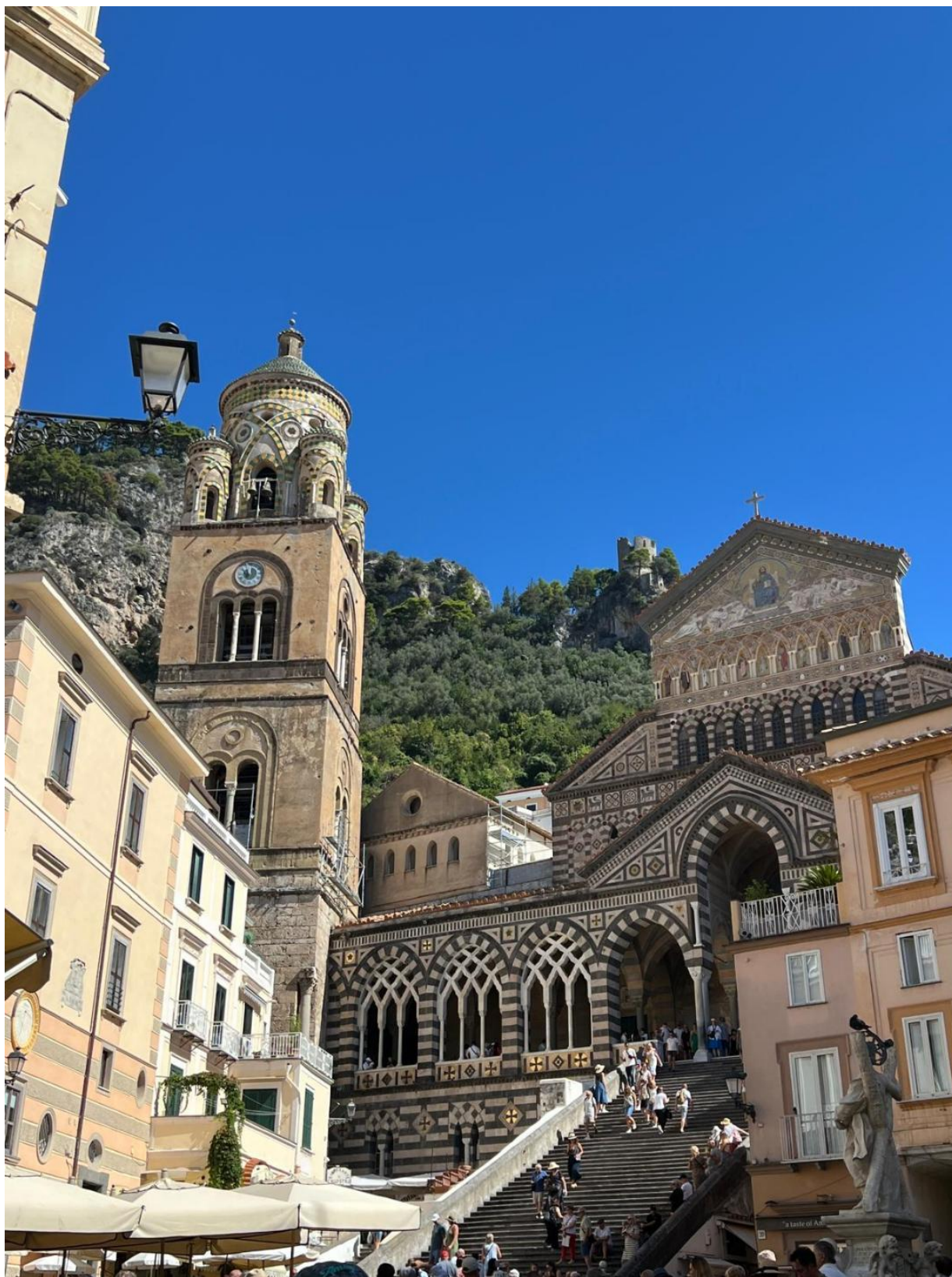
La Cattedrale di Amalfi vista dalla scalinata monumentale