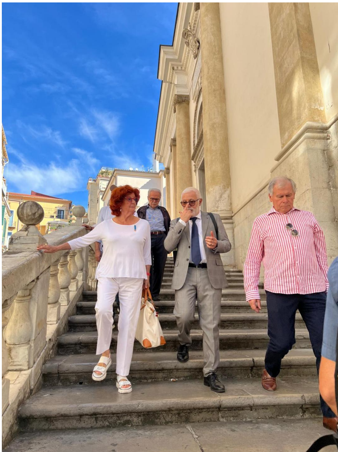
Continua la visita guidata del complesso storico di Salerno