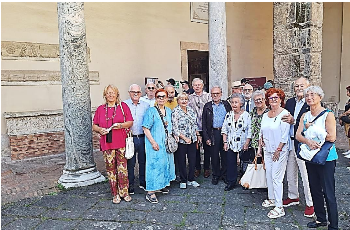
I Commandeurs iniziano la visita guidata di Salerno