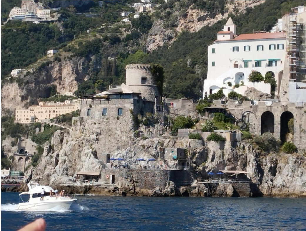
Uno scorcio della costiera amalfitana con una antica torre di avvistamento