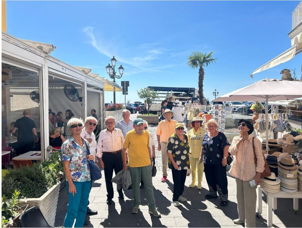
I Commandeurs all'imbarco per Amalfi