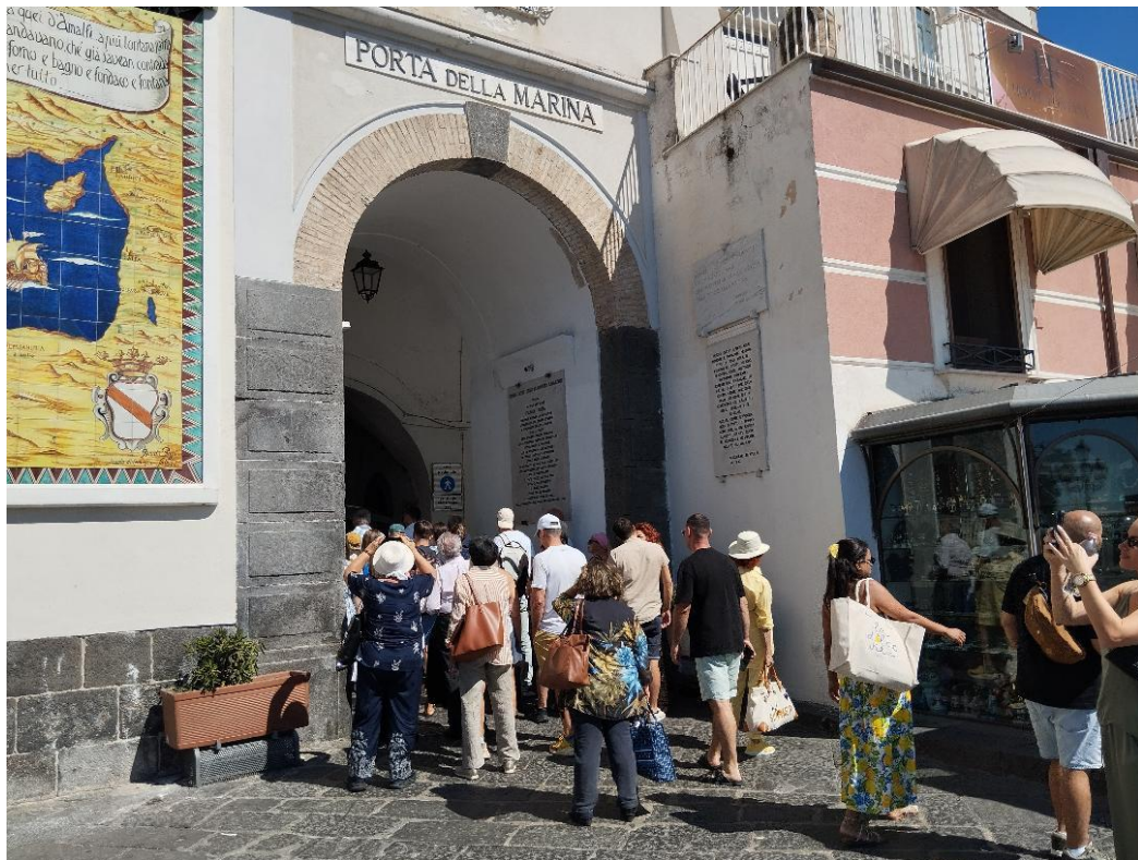
I Commandeurs alla Porta Marina di Amalfi