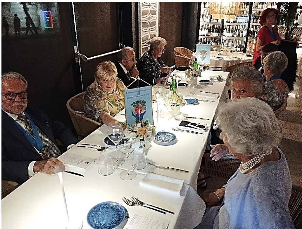
La tavolata alla Cena di Gala al Bistrot di Pescheria