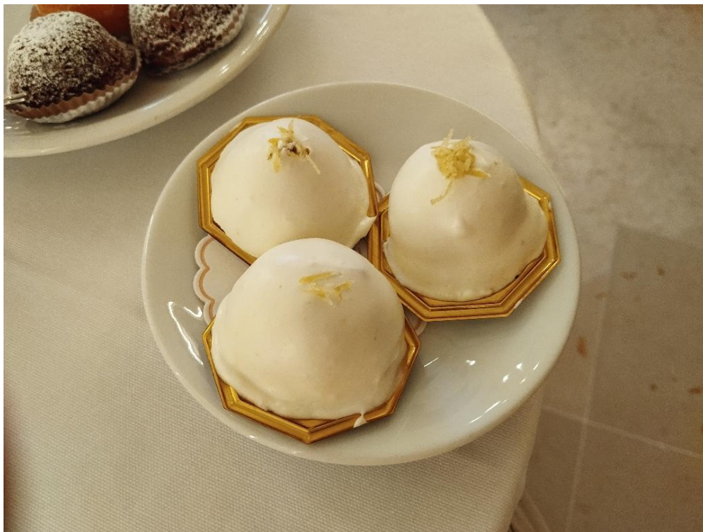
Le Delizie al Limone dell'antica pasticceria Pansa di Amalfi