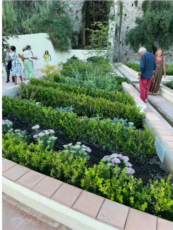
Una sezione del Giardino della Minerva con una aiuola delle Erbe dei Semplici