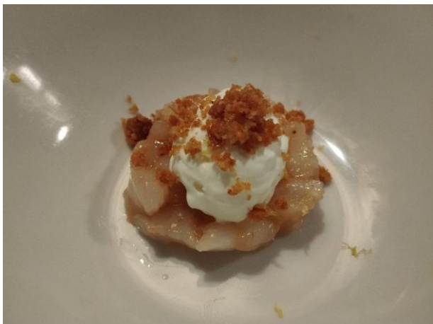
Tartare di gambero bianco