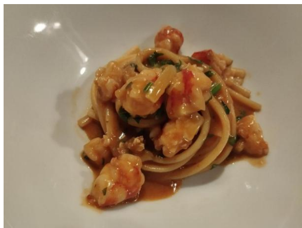
Linguine con mazzancolle