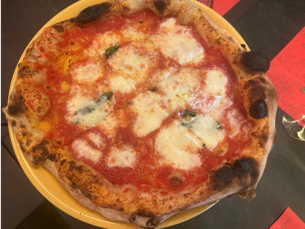
Pranzo veloce con la pizza e i fritti della Pizzeria Giaggiù