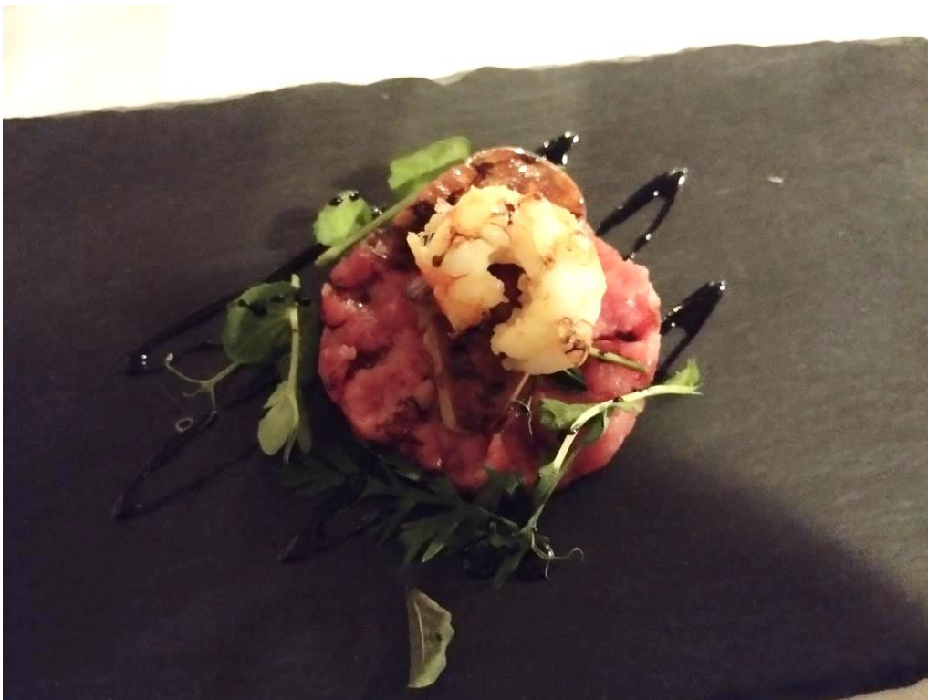
La battuta al coltello con gambero e foie gras