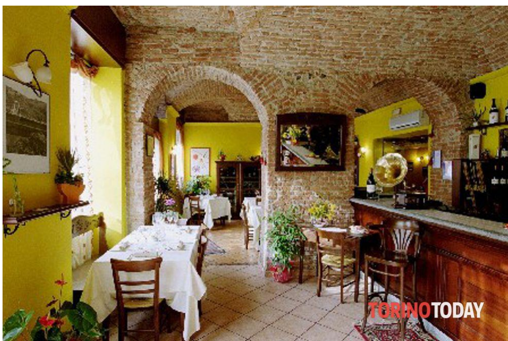
Ristorante Piccolo Lord di Torino, l'interno

La Commanderie conferma così il suo impegno nel valorizzare la cultura gastronomica e l'importanza dello stare insieme, con l'auspicio di ritrovarci presto per nuove occasioni di festa e condivisione.