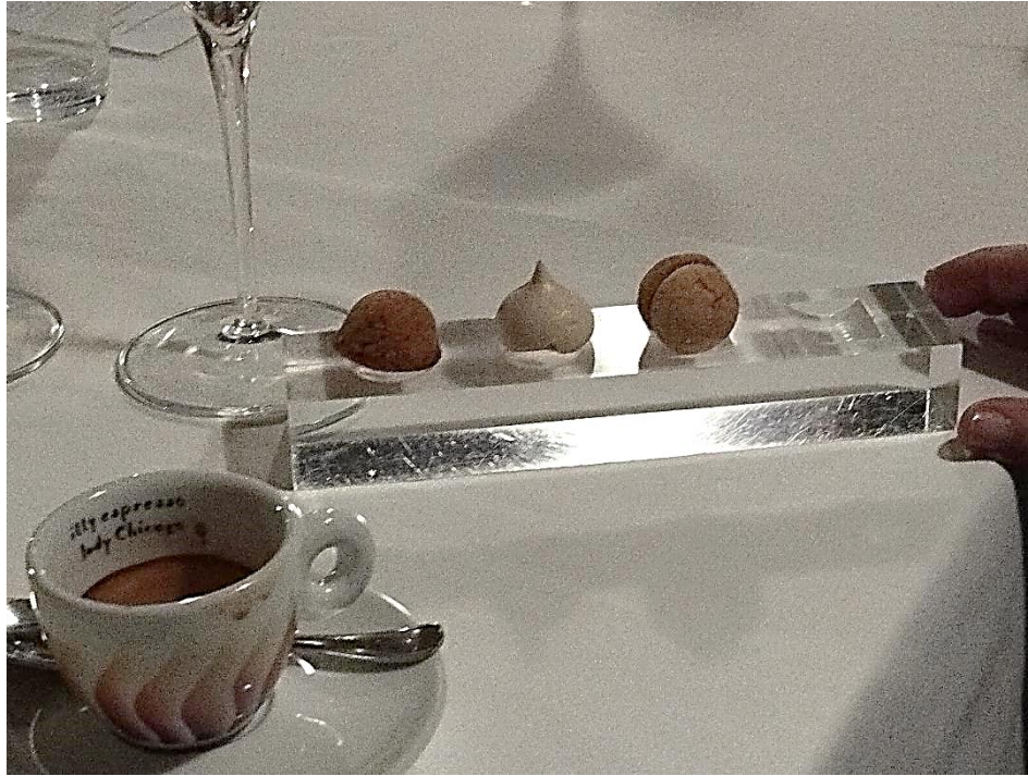
I dolcetti e il caffè di fine serata