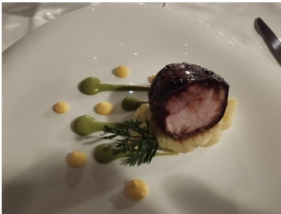
Il filetto di maialino in crosta di caffè