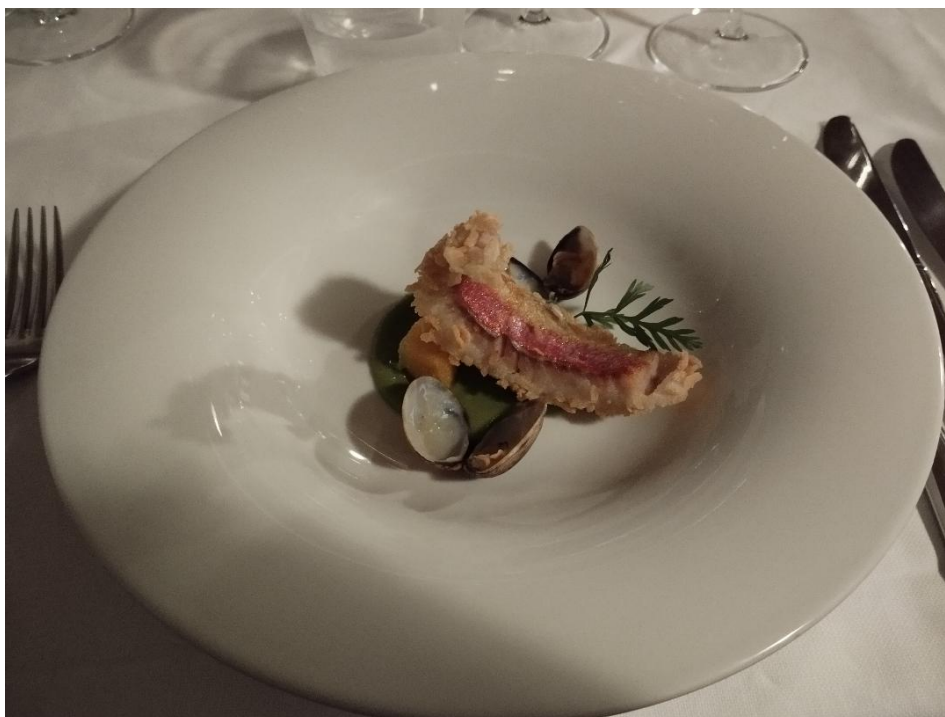
La triglia croccante con le conchiglie