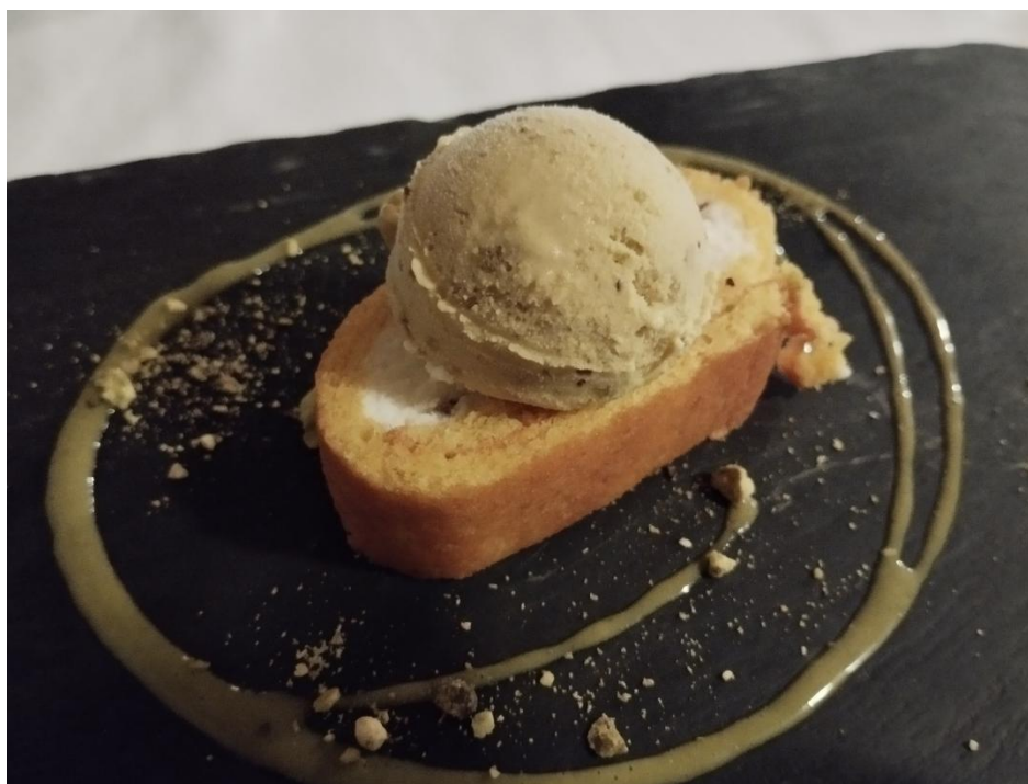
Il rotolo di torrone al cioccolato bianco