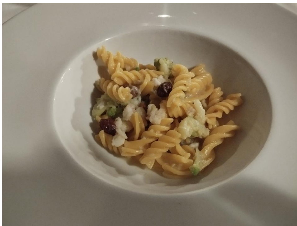
I fusilli col ragù di pescatrice