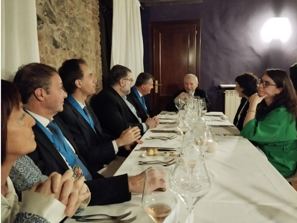
La tavolata con i due nuovi aspiranti Commandeurs