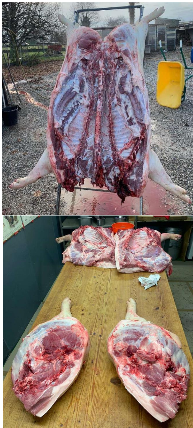
Foto 1-2. Apertura del maiale e primo macello

Sembra impossibile, in quei momenti, che un animale così puzzolente diventi, con mani sapienti e cultura antica, profumato culatello su gnocco fritto, trasparente lardo su crostino caldo, gustoso salame, musetto che si scioglie in bocca, irresistibile fetta di prosciutto variegato, ciccioline, salsicette a grana fine speziate, marcundela e i vari soppressa, ossocollo, pancetta arrotolata, guanciali, etc.,