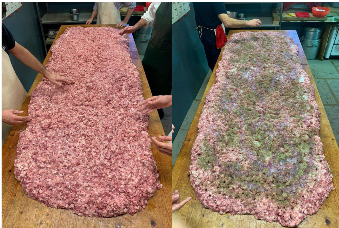
Foto 10-11. Preparazione della salsiccia