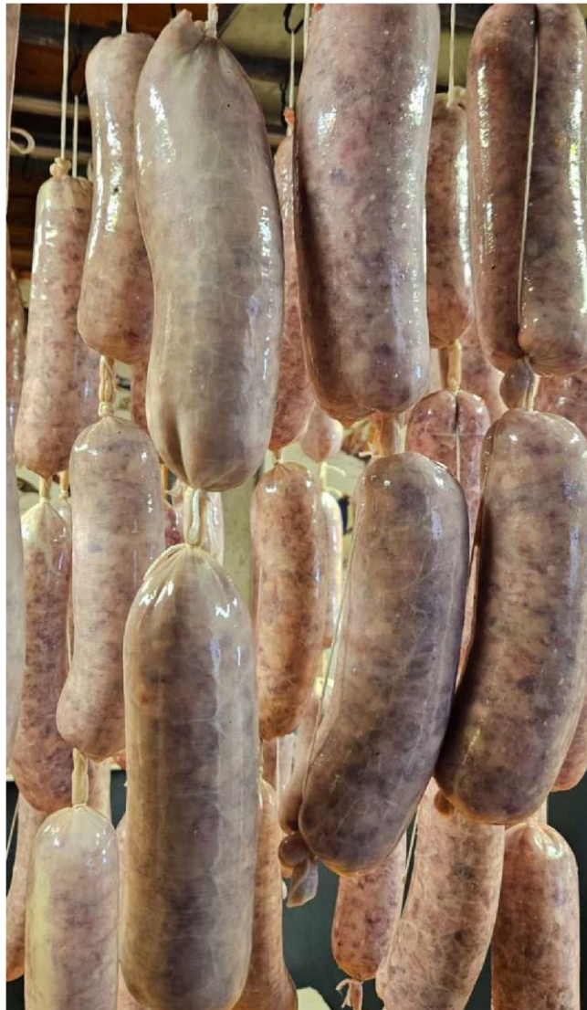
Foto 14. Cotechini appesi

Tuttora i cotechini rappresentano con forma e gusto l'abbondanza del maiale e il messaggio beneaugurante per l'Anno Nuovo.