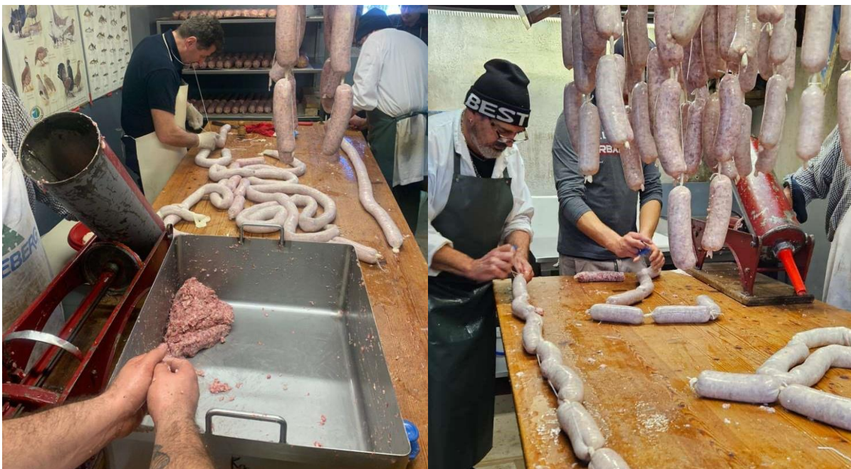
Foto 7-8. Processo della macchina insacatrice e della legatura

Si inserisce il macinato speziato nella macchina insacatrice e l'esperto legatore procede da par suo, punzecchiando le salsicce con l'apposito multipunteruolo.