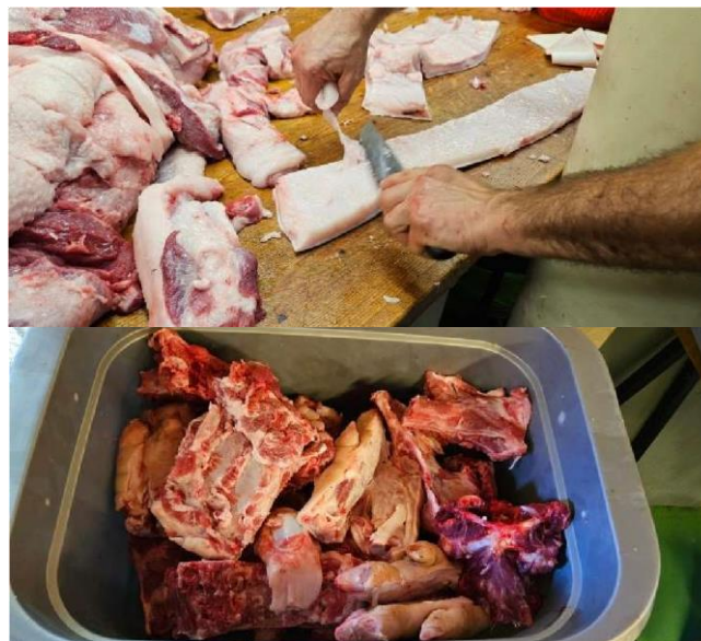
Foto 5-6. Macello e disosso delle carni

Poi, si disossa, lasciando un po' di carne attaccata per la delizia della “festa delle ossa” una settimana dopo, servite lessate e calde con sale grosso, kren o senape. Da mangiare con le mani, come facevano i nostri antenati centinaia di anni fa, con il grande contenitore fumante in mezzo al tavolo, e attenzione ...scotta !