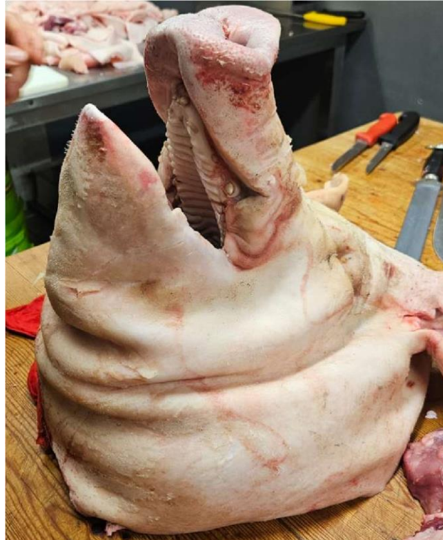
Foto 9. Muso del maiale