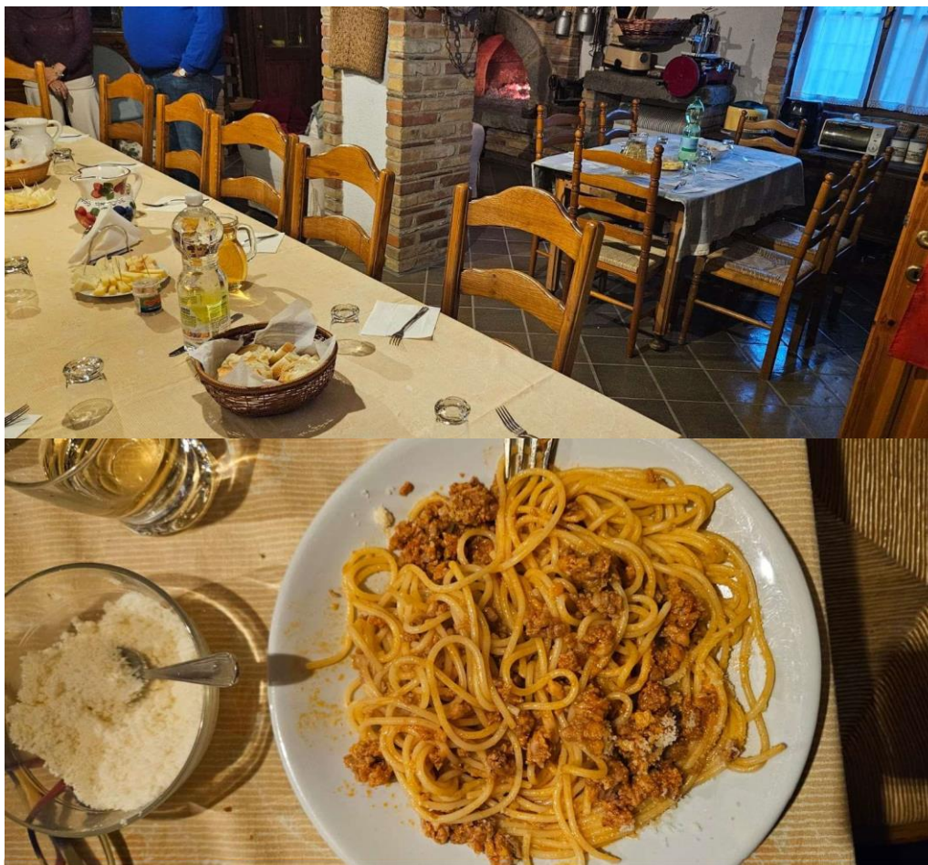
Foto 17-18. Fine delle preparazioni e festa conclusiva