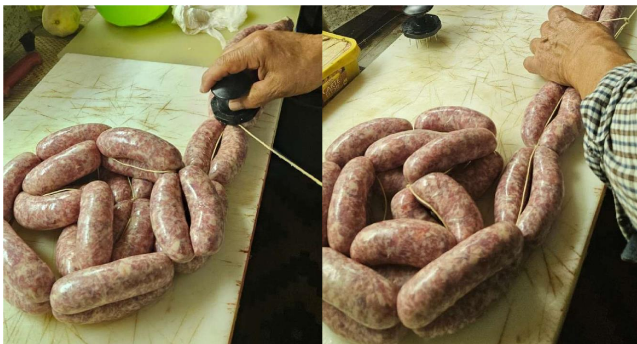
Foto 12-13. Legatura e punzonatura delle salsicce Cotechino