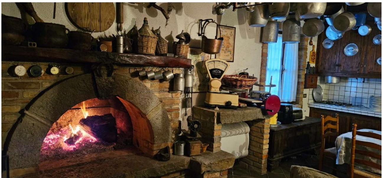
Foto 4. Focolare della casa

Ripreso il lavoro, ricco di battute, “taiut” vari, allegria inevitabile e tipica, discendente dall'eccitante ruolo storico e importante rivestito, gli operatori si esibiscono con maestria a realizzare quei miracoli di gusto che costituiscono una tradizione immarcescibile, e speriamo perseguita dalle nuove generazioni, purtroppo spesso distratte ed attratte da altre forme di cultura culinaria moderne o esotiche. Per stimolare la curiosità degli studenti e stimolarne l'emulazione è stato prodotto un bel filmato distribuito nelle scuole del FVG, girato proprio a casa di mio cugino.