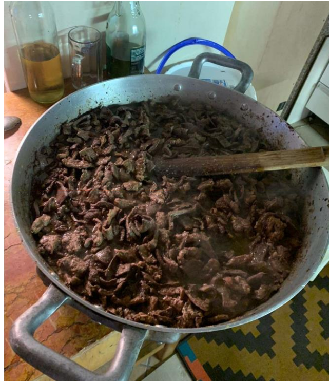
Foto 3. Preparazione del fegato

Ripreso il lavoro, ricco di battute, “taiut” vari, allegria inevitabile e tipica, discendente dall'eccitante ruolo storico e importante rivestito, gli operatori si esibiscono con maestria a realizzare quei miracoli di gusto che costituiscono una tradizione immarcescibile, e speriamo perseguita dalle nuove generazioni, purtroppo spesso distratte ed attratte da altre forme di cultura culinaria moderne o esotiche. Per stimolare la curiosità degli studenti e stimolarne l'emulazione è stato prodotto un bel filmato distribuito nelle scuole del FVG, girato proprio a casa di mio cugino.