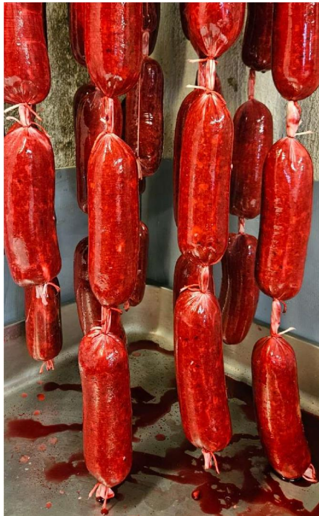
Foto 16. Sanguinacci appesi

Il sanguinaccio si lasciava appeso ad asciugare per qualche giorno e poi si poteva consumare fresco, cioè, tagliato a rondelle e rosolato in padella, lessato e anche inserito nei minestrini, messo con previa rosolatura in frittata