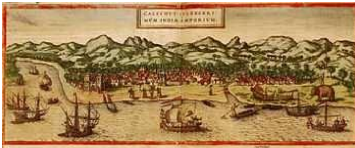
Una immagine di Calicut, India pubblicata nel 1572 durante il controllo portoghese del commercio del Pepe

Il prezzo esorbitante del Pepe durante il medioevo ed il monopolio del commercio detenuto dalle Repubbliche marinare italiane, fu uno dei motivi che indusse il Portogallo a cercare una rotta marina per l'India. Nel 1498 Vasco da Gama fu il primo europeo a giungere in India via mare. A Calcutta gli Arabi gli chiesero perché fosse venuto e lui rispose "cerchiamo cristiani e spezie". Benché questo primo viaggio in India, passando per il capo di Buona Speranza, sia stato un modesto successo, i portoghesi tornarono presto in gran numero ed usando la loro superiore potenza navale ottennero il controllo completo del traffico delle spezie nell'oceano Indiano. Questo fu l'inizio del primo impero europeo in Asia che ebbe maggiore legittimazione (almeno da una prospettiva europea) dal trattato di Tordesillas che garantiva al Portogallo diritti esclusivi sulla metà del traffico mondiale del Pepe.