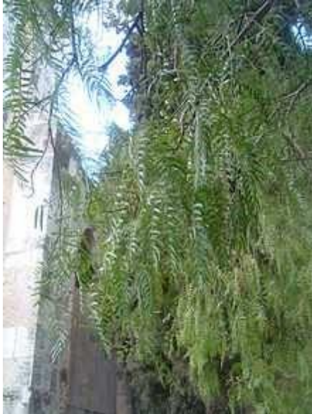
L'albero del Pepe

Nel viaggio di ritorno, le navi attraversarono il mar Rosso, dalle cui rive furono trasportate via terra o navigarono per il canale del Nilo fino al fiume Nilo e da qui su chiatte fino ad Alessandria. Da qui proseguirono per Roma. Questa rotta commerciale dall'India per l'Europa dominerà il commercio del Pepe per i 1500 anni a venire. Con le navi che partivano direttamente dalle coste del Malabar, il Pepe nero percorreva ora una rotta più breve rispetto al Pepe lungo e quindi il suo prezzo divenne più conveniente. Plinio il vecchio nella sua Storia naturale ci dice i prezzi a Roma intorno al 77 d.C.: Il Pepe lungo costava 45 denari al chilogrammo mentre il Pepe bianco costava 18 denari ed il Pepe nero soltanto 9 denari. Plinio si lamentava "non vi è anno in cui l'India non drena 50 milioni di sesterzi all'Impero romano" e altri moralismi sul Pepe: