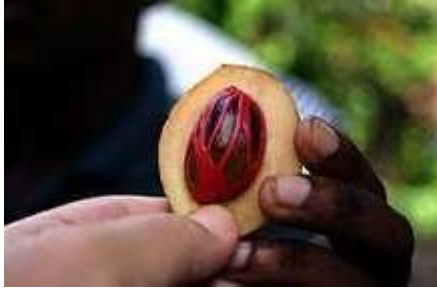
Noce Moscata e Macis (la parte rossa)

La noce moscata (da "noce di Mascate" che non è il luogo di origine ma è il posto dal quale cominciò ad essere commercializzata) è una spezia usata in cucina. Il seme della pianta, di forma ovale arrotondata, ha sapore e odore particolari, dovuti alla presenza di un olio aromatico.