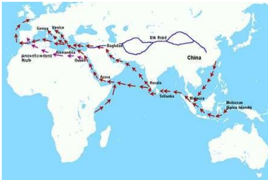
Rotte commerciali dell' antichità

I Nabatei, un popolo nomade di commercianti del nord dell'Arabia, erano grandi viaggiatori e furono loro ad aprire la prima strada carovaniere, la Via dell'Incenso, circa otto secoli a.C. Con lunghe colonne di cammelli e asini, arrivarono fino in India e in Cina.