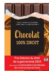
3 ème Prix littéraire 2024

Pour plus d'informations, contact par mail cordons.bleus.france@gmail.com ou par téléphone +33 6 13 23 49 17