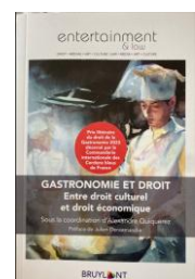
2 ème Prix littéraire 2023