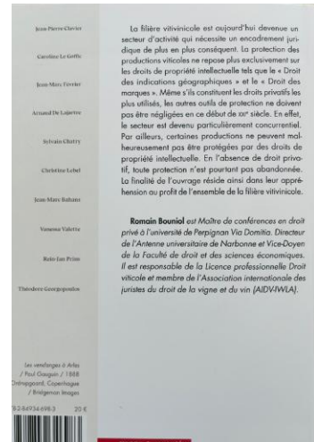
4 ème Prix Littéraire 2025 Liste des coauteurs